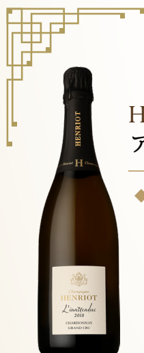
HENRIOT L'inattendue Chardonnay Grand Cru 2018 アンリオ リナタンデュ シャルドネ グランクリュ 2018

上質なシャルドネがもたらす繊細さ、優雅さを表現したアンリオのアイデンティティともいえるキュヴェ。非常にきめ細やかな泡立ち。白い花やレモン、焼き菓子やフレッシュバターなどを思わせる複雑なアロマ。エレガントでバランスの良い味わいです。