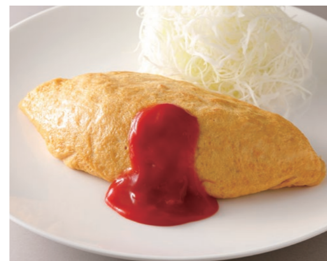
Chicken Omurice チキンオムライス ¥3,300 [ Small ¥2,500 / Half ¥2,300 ]