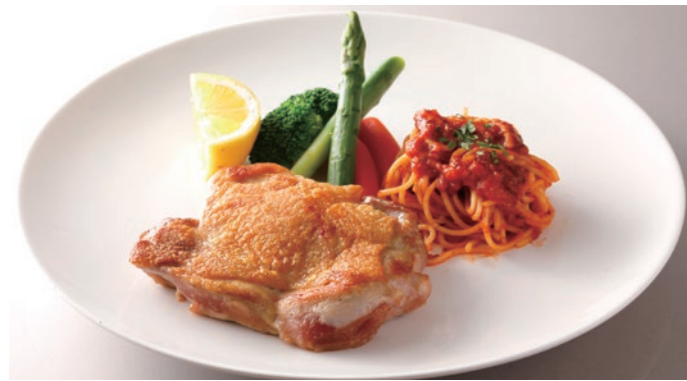
Sauteed Chicken チキンソテー ¥3,800