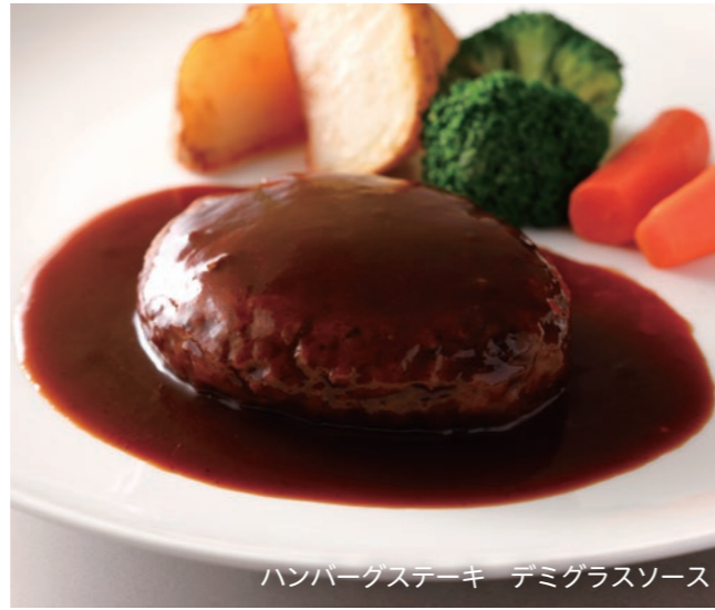
Hamburger Steak (Soy or Demi-glace Sauce) (w/ Rice or Bread) ハンバーグステーキ (和風またはデミグラスソース)(ライスまたはパン付) ¥4,000