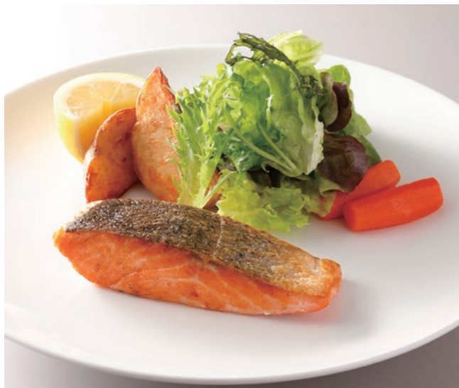
Sauteed Salmon with Herb Butter (w/ Rice or Bread) サーモンのソテー ハーブバター添え (ライスまたはパン付) ¥3,800