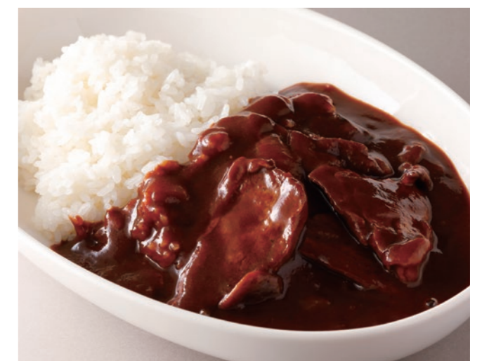
Hayashi Rice 銀座ハヤシライス ¥3,700 [ Small ¥2,900 / Half ¥2,700 ] Select | 白米または、"J シリアル" より、お選びいただけます。 Choose white or J-cereal rice

● 別途、サービス料を加算させていただきます。 / Service charge will be added to your bill. ● 食材によるアレルギーのあるお客さまは、あらかじめ係にお申しつけください。 / Please inform us if you have any food allergies or special preferences. ● 食材の入荷状況によりメニュー内容が変更になる場合がございます。 / The above menu is subject to change without prior notice.