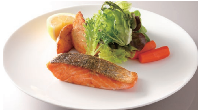
Sauteed Salmon with Herb Butter GF サーモンのソテー ハーブバター添え ¥3,800