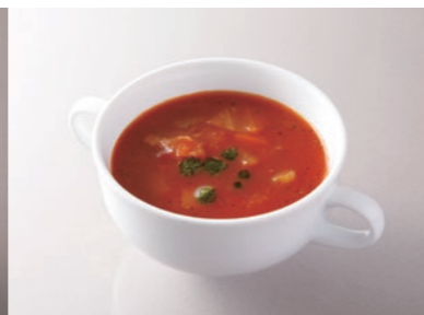
Minestrone 緑黄色野菜たっぷり ミネストローネスープ ¥1,100