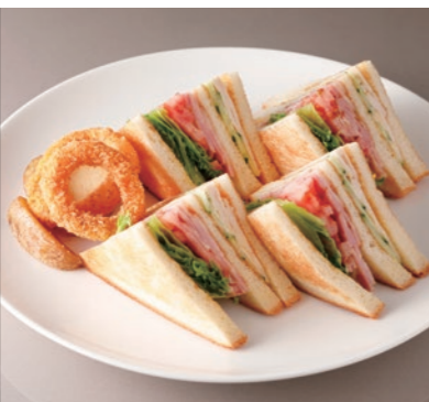
Club Sandwich アメリカン クラブハウス サンドウィッチ (Chicken, Vegetables, Bacon) ¥2,700