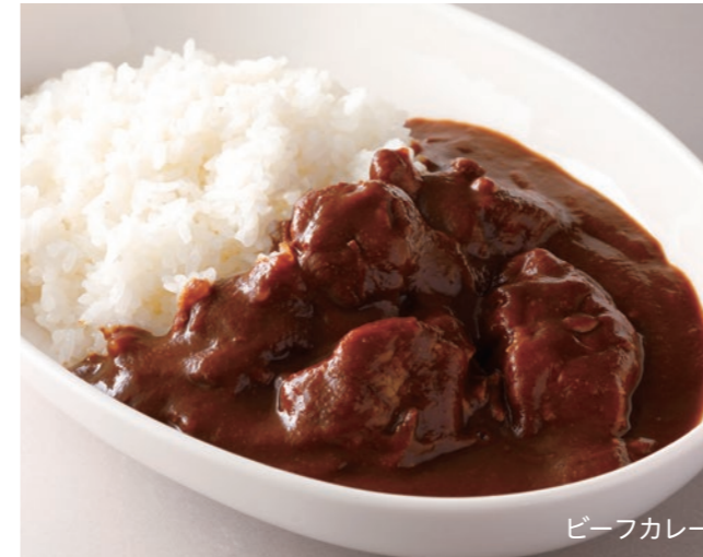
Beef or Shrimp Curry ("Extra Hot" also available.) ビーフカレー または 小海老カレー (エキストラホットも承ります) ¥3,300 [ Small ¥2,500 / Half ¥2,300 ] Select | 白米または、"J シリアル" より、お選びいただけます。 Choose white or J-cereal rice