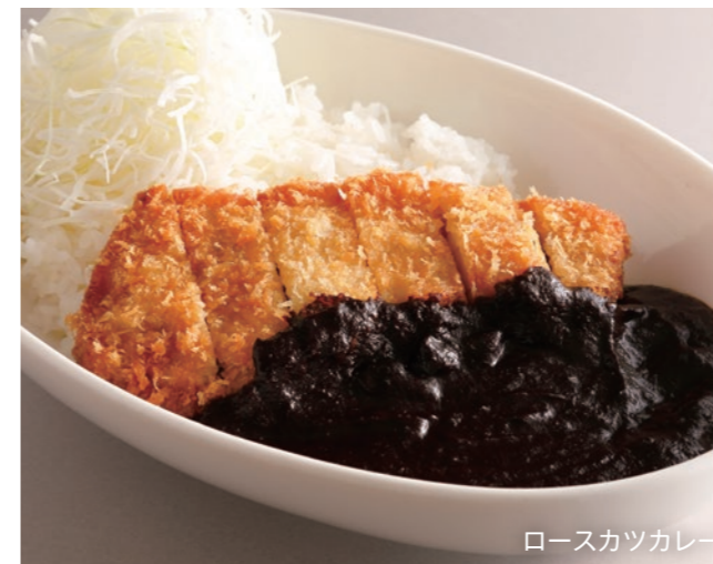
Curry on Rice with Pork Cutlet (Filet or Loin) ポークカツカレー (フィレまたはロース) ¥4,800 Select | 白米または、"J シリアル" より、お選びいただけます。 Choose white or J-cereal rice