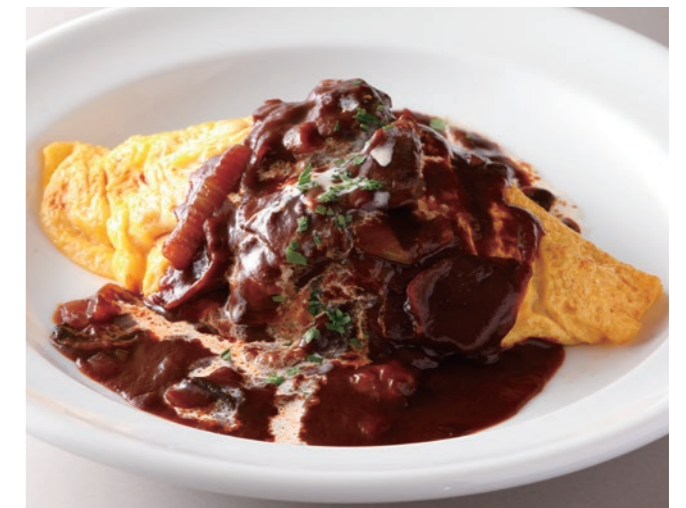
Wagyu Hayashi Stew on Omurice 黒毛和牛の オムハヤシライス ¥4,800 [ Small ¥3,600 / Half ¥3,400 ]