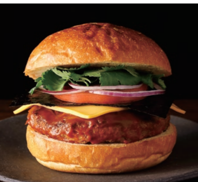
SATSUKI's Burger SATSUKI 新東京バーガー w/ Wagyu Patty ¥4,600 w/ Soy Patty V ¥3,900