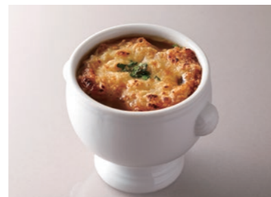
French Onion Soup オニオングラタンスープ ¥1,600