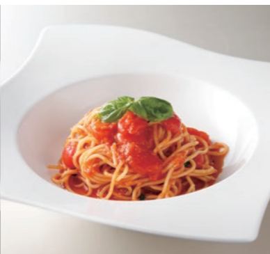
Spaghetti Pomodoro V ポモドーロ スパゲッティ ¥2,400 Made w/ ZENB yellow pea pasta GF + ¥550