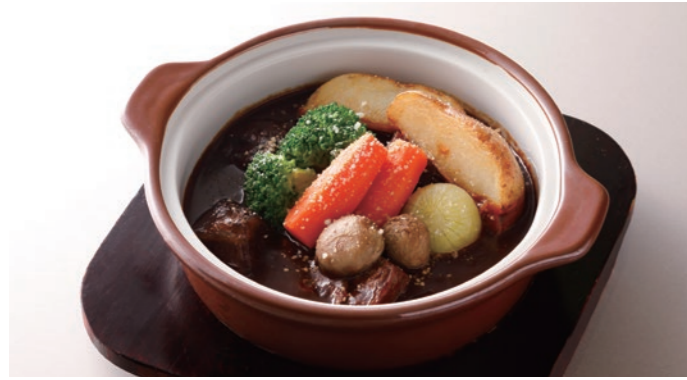
Beef Stew ビーフシチュー ¥4,600