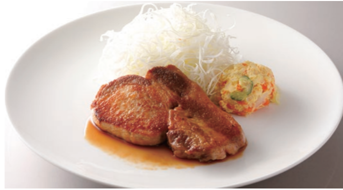
Sauteed Pork in Garlic Soy Sauce ポークソテー ガーリック醤油風味 ¥4,000