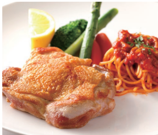
Sauteed Chicken (w/ Rice or Bread) チキンソテー (ライスまたはパン付) ¥3,800