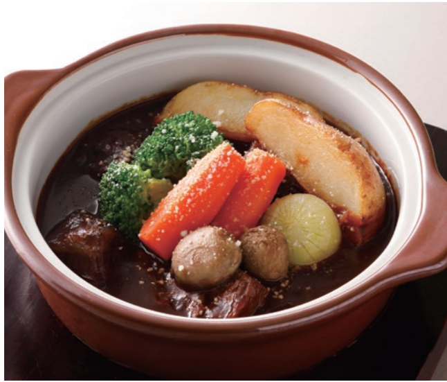
Beef Stew (w/ Rice or Bread) ビーフシチュー (ライスまたはパン付) ¥4,600