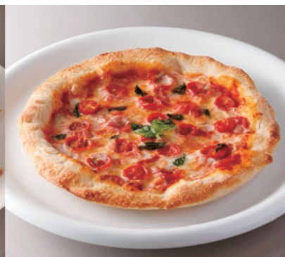
Pizza Margherita V マルゲリータ ¥2,500