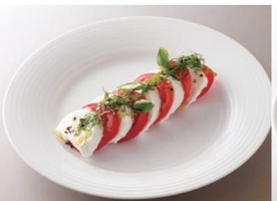
Caprese Salad V GF 完熟トマトと モzzarellaチーズの カプレーゼサラダ ¥2,400