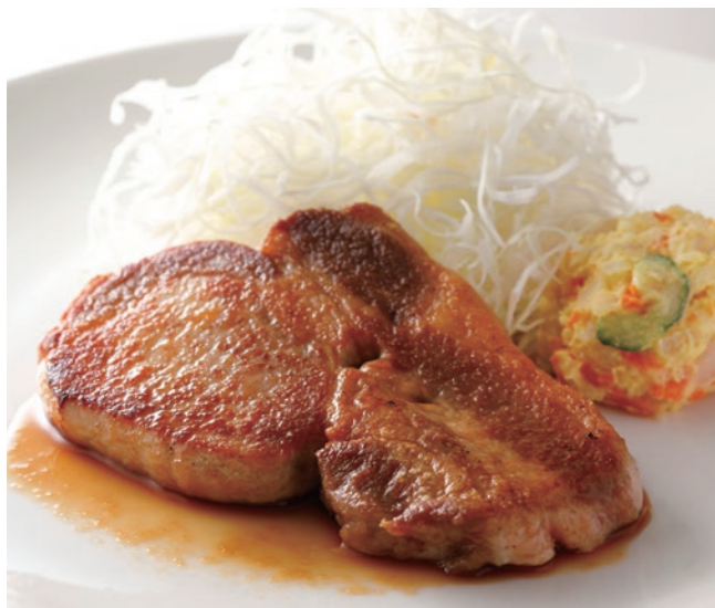
Sauteed Pork in Garlic Soy Sauce (w/ Rice or Bread) ポークソテー ガーリック醤油風味 (ライスまたはパン付) ¥4,000