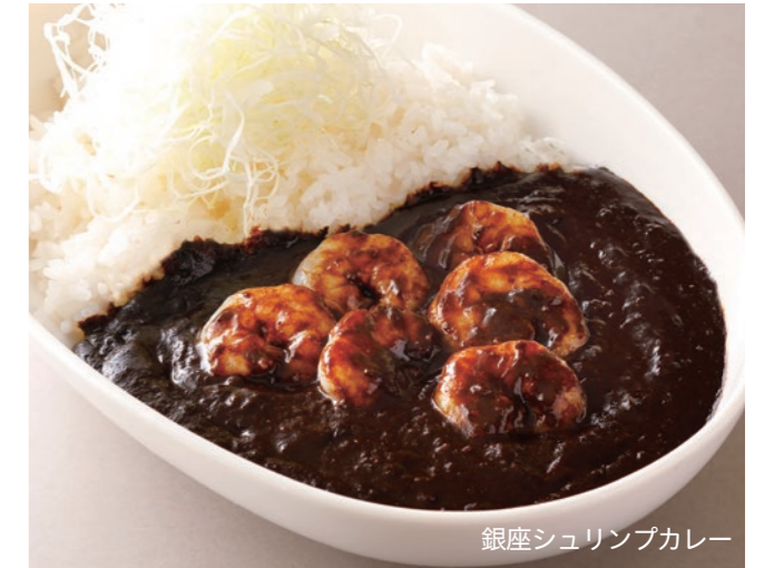
Black Beef or Shrimp Curry 銀座ビーフカレー または 銀座シュリンプカレー ¥3,400 [ Small ¥2,600 / Half ¥2,400 ] Select | 白米または、"J シリアル" より、お選びいただけます。 Choose white or J-cereal rice