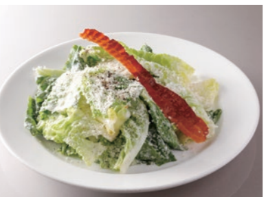
Caesar Salad シーザーサラダ ¥2,100 Chikcken + ¥300 Shrimp + ¥300 Tuna + ¥300