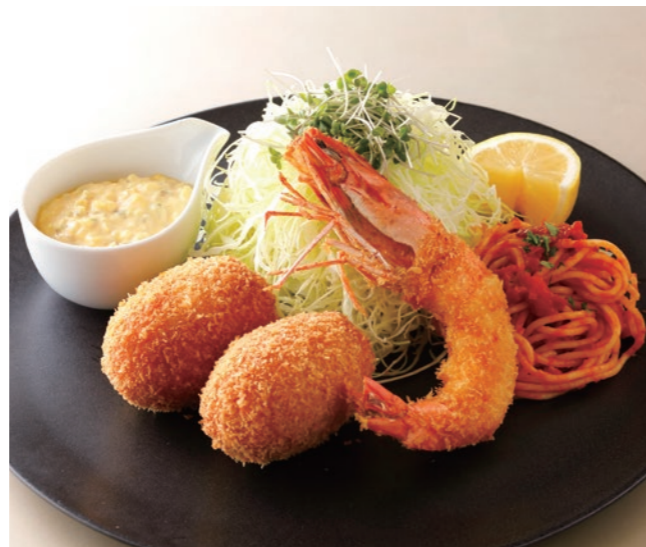
Breaded Prawn & Crab Croquette (w/ Rice or Bread) 海老フライと蟹クリームコロッケ (ライスまたはパン付) ¥5,000