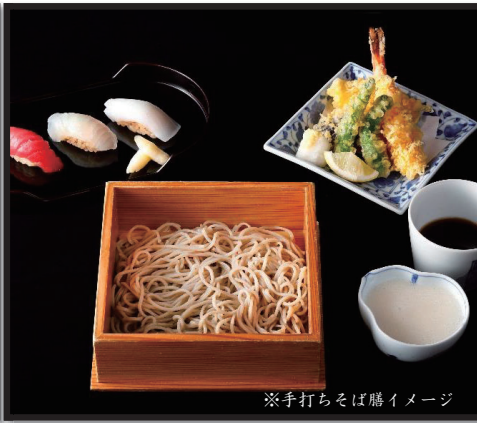
※手打ちそば膳イメージ