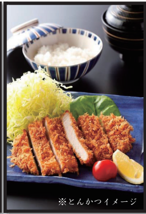
※とんかつイメージ