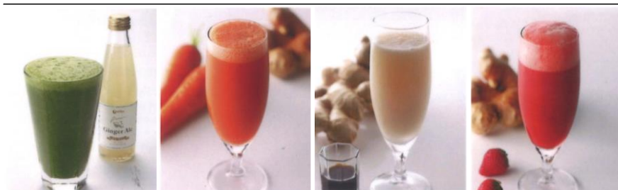
Mustard Spinach Blended Juice with Soda or Ginger Ale