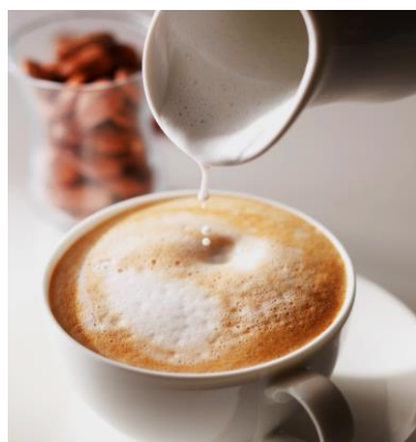
Almond Milk Latte