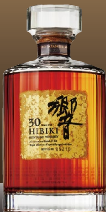
HIBIKI 30 years old