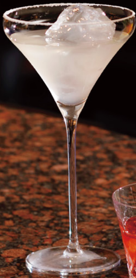
Premium Margarita プレミアム・マルガリータ