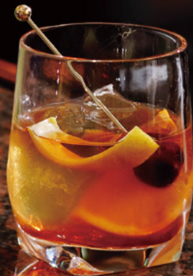
Old Fashioned オールドファッション