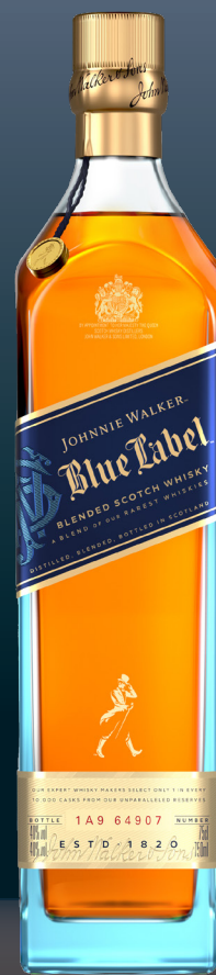
JOHNNIE WALKER BLUE LABEL

英国王室御用達を初めて賜ったシングルモルトウイスキー。パロ・コルタドシェリー樽でフィニッシュしたことによる、複雑で豊かなスパイシーさ、クリーミーなバナナ、切れのあるシトラスの香りが特徴。