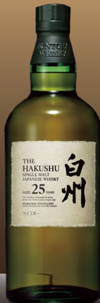
THE HAKUSHU 25 years old