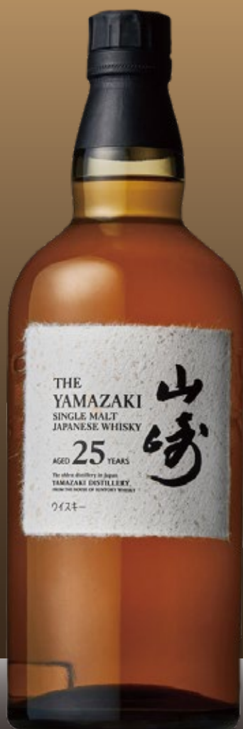
THE YAMAZAKI 25 years old