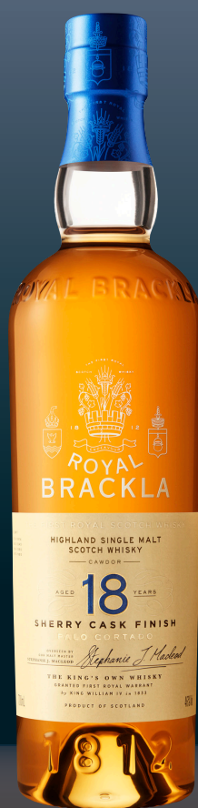
ROYAL BRACKLA 18 YEARS OLD

今年 180 周年を迎えるスコッチブランド。アバフェルディを中心に 18 年以上熟成された原酒をブレンドしており、なめらかな味わいの中にアーモンドやバナナ、バターのような甘い香りやココが特徴。