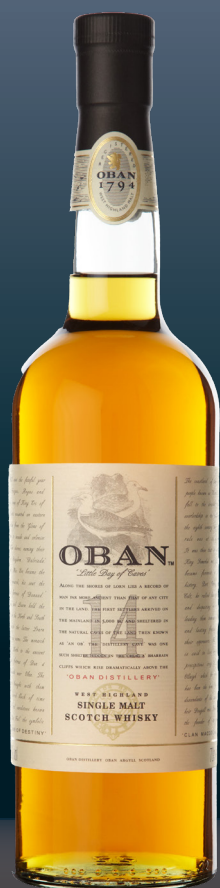
OBAN 14 YEARS OLD