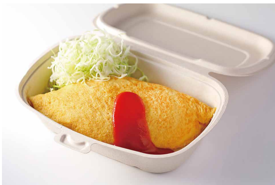
チキンオムライス

Chicken Omu-rye (Omelet on Ketchup Fried Rice)