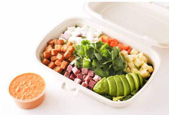
SATSUKIチョップドサラダ (スパイシーサウザン) SATSUKI Chopped Salad (Spicy Southern) ¥2,400