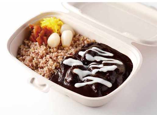
銀座シュリンプカレー

※ライスを白米又はJシリアル米よりお選びください。 Old Fashioned Shrimp Curry with Steamed Rice