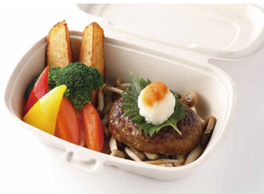
ハンバーグステーキ 和風ソース