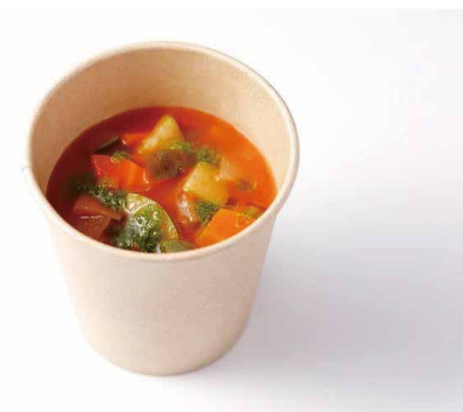
緑黄色野菜たっぷりの ミネストローネスープ Minestrone Soup ¥1,100