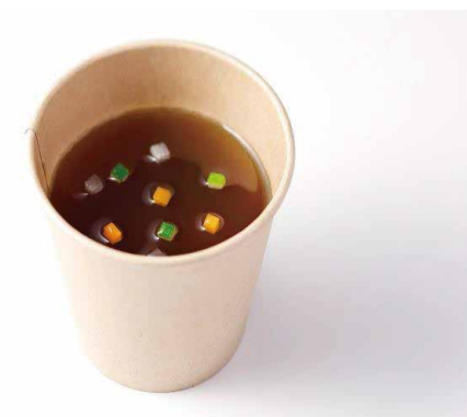
ビーフコンソメ Beef Consommé ¥1,400