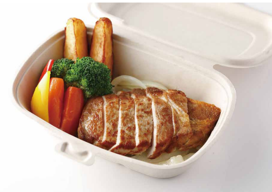
ポークソテー ガーリック醤油風味