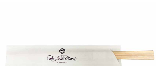
箸 Chopsticks ¥ 20