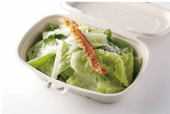
シーザーサラダ Caesar's Salad ¥2,100