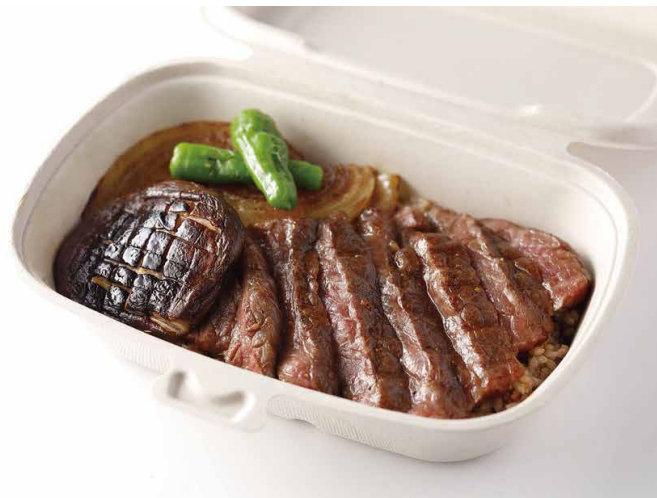
黒毛和牛の Jシリアルビフテキ丼 Wagyu Steak on Jcereal Rice