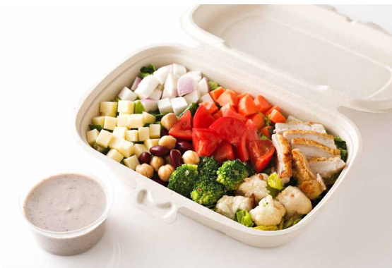
SATSUKIチョップドサラダ (クリーミーナッツ) SATSUKI Chopped Salad (Creamy nuts) ¥2,400