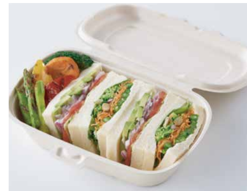
ベジタブルサンドウィッチ Vegetable Sandwiches