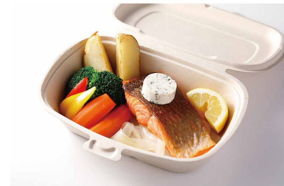
サーモンソテー ハーブバター添え