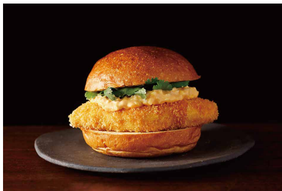
新東京フィッシュバーガー ※パクチー別添え ※フライドポテト付き Tokyo Fish Buger