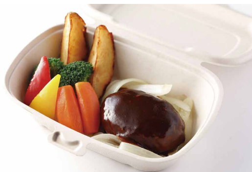
ハンバーグステーキ デミグラスソース