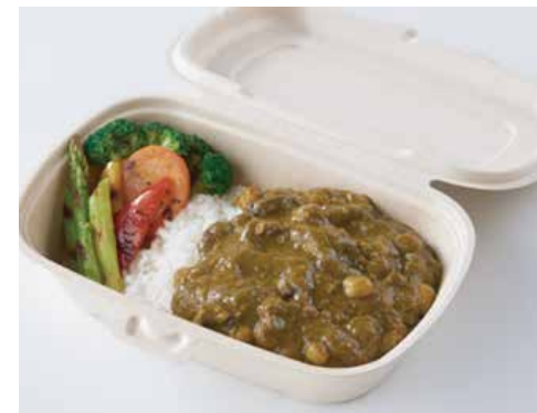
ヴィーガンカレーライス Vegan Curry on Rice