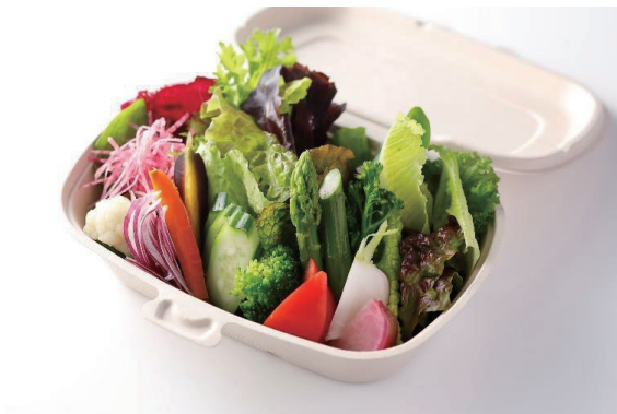
季節のフレッシュ野菜サラダ Seasonal Fresh Salad ¥ 2,100