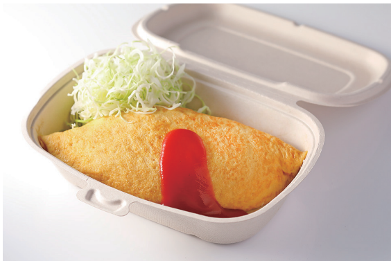
チキンオムライス

Chicken Omu-rice (Omelet on Ketchup Fried Rice)