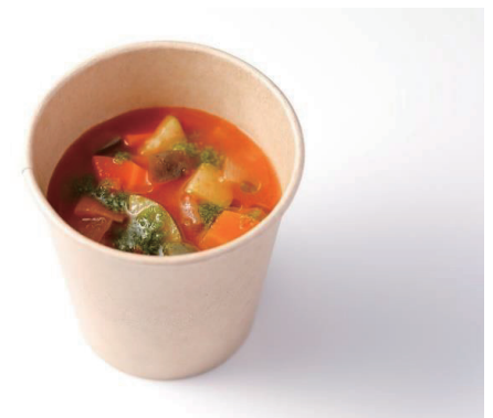
緑黄色野菜たっぷりの ミネストローネスープ Minestrone Soup ¥ 1,100