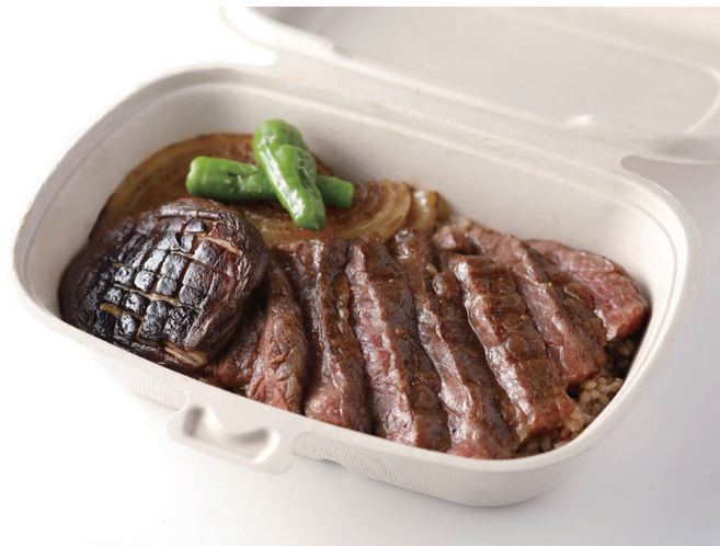
黒毛和牛の J シリアルビフテキ丼 Wagyu Steak on Jcereal Rice