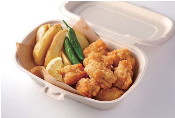
若鶏の唐揚げ フライドポテト添え Japanese-style Fried Chicken with French Fries ¥ 2,800