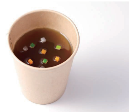
ビーフコンソメ Beef Consommé ¥ 1,400