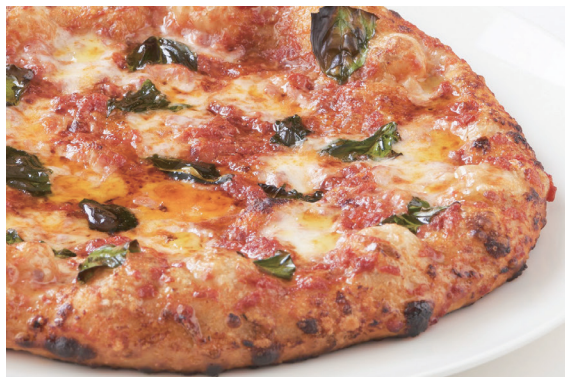
ピッツァ マルゲリータ Pizza Margherita