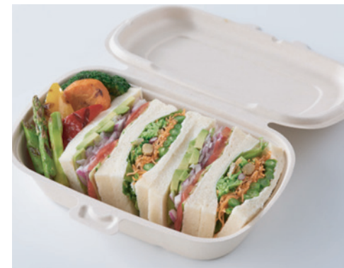
ベジタブルサンドウィッチ Vegetable Sandwiches