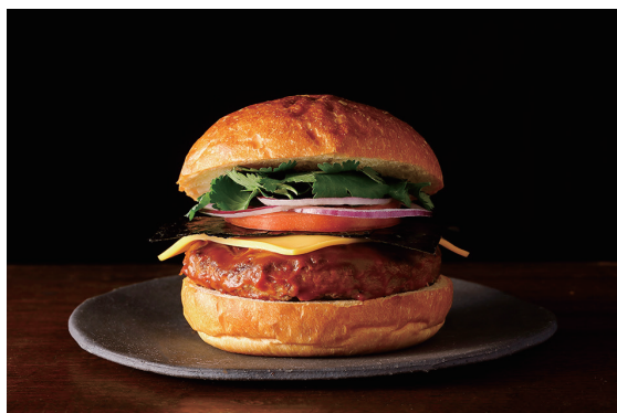
新東京バーガー 和牛パティ ※パクチー別添え ※フライドポテト付き Tokyo Burger (Wagyu Patty)