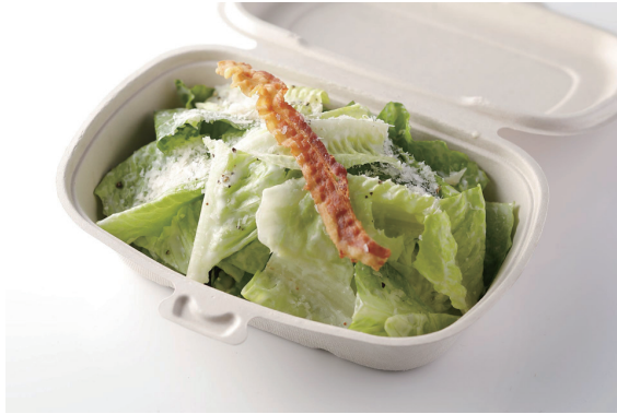
シーザーサラダ Caesar's Salad ¥ 2,100