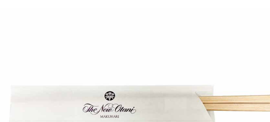
箸 Chopsticks ¥ 20