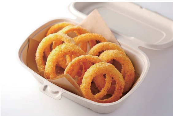
オニオンリングフライ Fried Onion ¥ 1,000