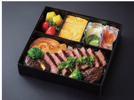
国産牛ステーキ重 (玉子焼き、香の物、酢の物、果物付) Domestic Beef Steak on Rice (Japanese rolled omlet/Japanese Pickles/Vineger dish/fruits) ¥ 8,800