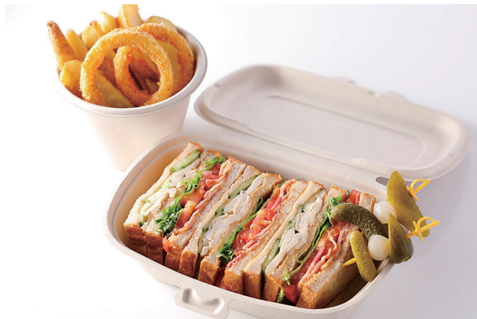
アメリカンクラブハウス サンドウィッチ American Clubhouse Sandwich