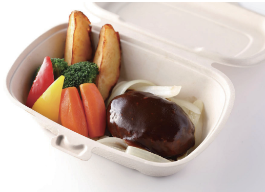
ハンバーグステーキ デミグラスソース

※ライス（白米・Jシリアル）又はパン付き Hamburger Steak with Demi-glace Sauce