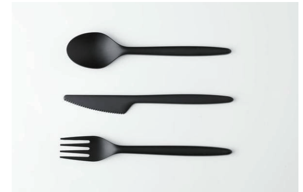
カトラリー (スプーン・ナイフ・フォーク) Each Spoon, Knife, Fork 各 ¥ 20