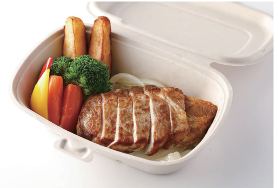
ポークソテー ガーリック醤油風味