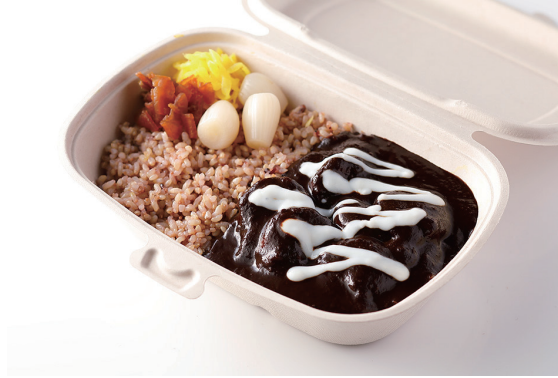
銀座ビーフカレー

※ライスを白米又はJシリアル米よりお選びください。 Old Fashioned Beef Curry with Steamed Rice ※Please choose white or multi-grain rice.