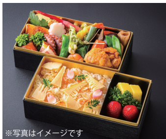
松花堂弁当 Seasonal Bento Box