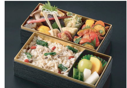
プラントベース弁当 ※2日前までの予約制 Plant-based Bento Box *Reservation required two days or more in advance. ¥ 4,800