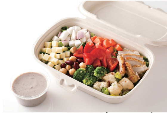
SATSUKIチョップドサラダ (クリーミーナッツ) SATSUKI Chopped Salad (Creamy nuts) ¥ 2,400