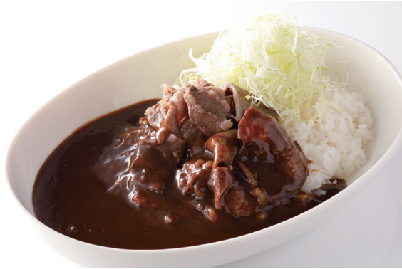
プレミアム甘口ビーフカレー Premium Mild Beef Curry