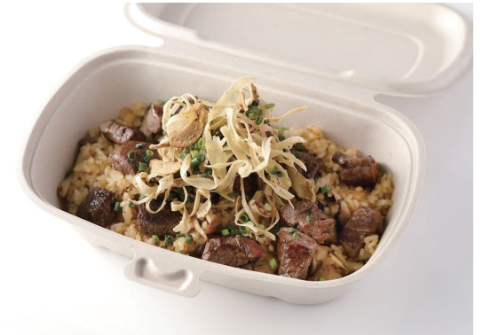
ビーフとキノコのピラフ ガーリック醤油風味

Beef and Mushroom Pilaf Flavored with Garlic & Soy Sauce