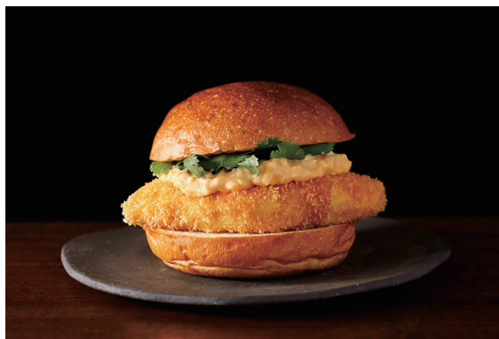
新東京フィッシュバーガー ※パクチー別添え ※フライドポテト付き Tokyo Fish Buger