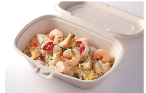
シーフードピラフ ニューバーグソース添え Seafood Pilaf with New Burg Sauce