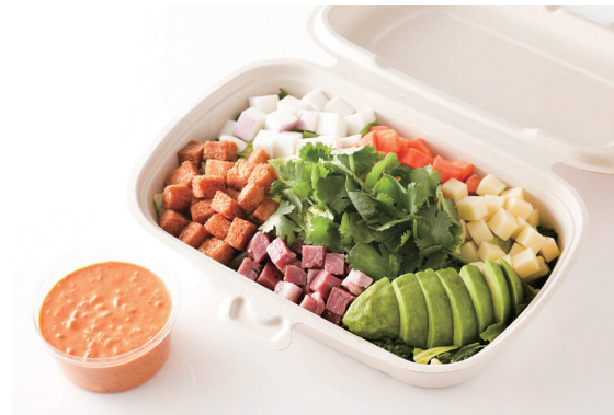
SATSUKIチョップドサラダ (スパイシーサウザン) SATSUKI Chopped Salad (Spicy Southern) ¥ 2,400