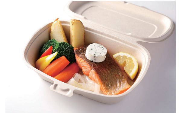
サーモンソテー ハーブバター添え