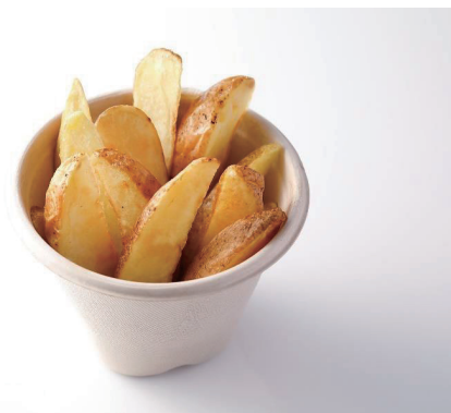
フライドポテト French Fries ¥ 1,000