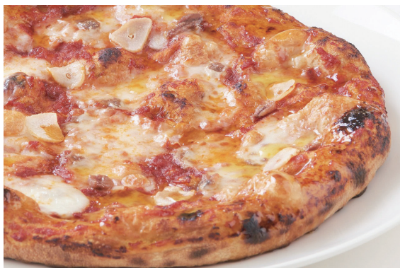
ピッツァ マリナーラ Pizza Marinara