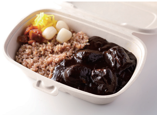
銀座シュリンプカレー

※ライスを白米又はJシリアル米よりお選びください。 Old Fashioned Shrimp Curry with Steamed Rice ※Please choose white or multi-grain rice.