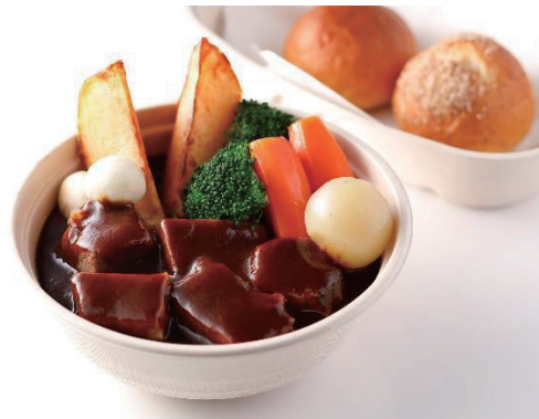
下町ビーフシチュー