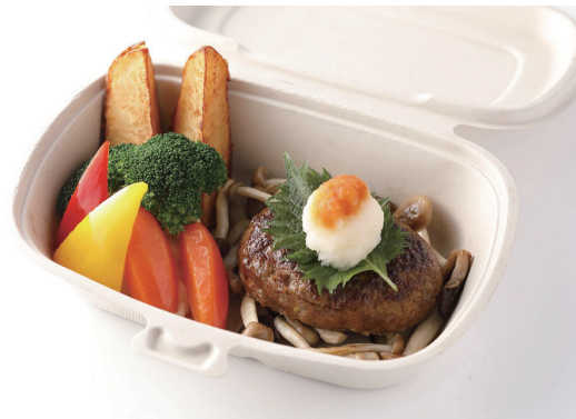
ハンバーグステーキ 和風ソース