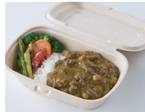
ヴィーガンカレーライス Vegan Curry on Rice