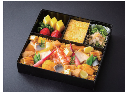
新江戸前ばらちらし (玉子焼き、小菜、果物付) Scattered sushi box with Diced Toppings (Japanese rolled omlet/Small side dish/fruits) ¥ 8,500