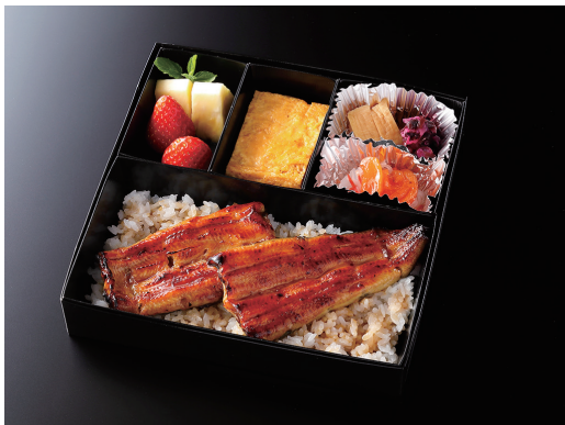
うな重 (玉子焼き/香の物/酢の物/果物)

Broiled Unagi Eel on Rice (Japanese rolled omlet/Japanese Pickles/Vinegar dish/fruits)