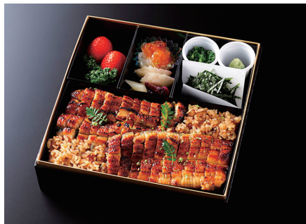
鰻まぶし (出汁、香の物、酢の物、果物付) Baked Eel on Rice (Japanese rolled omlet/Japanese Pickles/Vinegar dish/fruits) ¥ 9,800