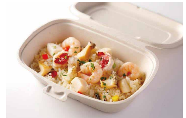
シーフードピラフ ニューバーグソース添え Seafood Pilaf with New Burg Sauce