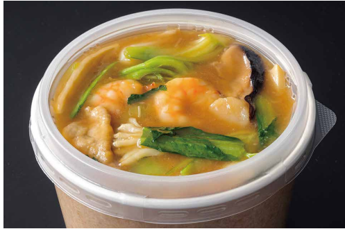
五目あんかけ焼きそば Fried Noodles with Seafood and Pork