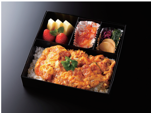
かつ重 (香の物/酢の物/果物)

Breaded pork cutlet with Eggs on rice (Japanese Pickles/Vinegar dish/fruits)