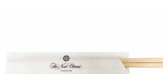
箸 Chopsticks ¥ 20