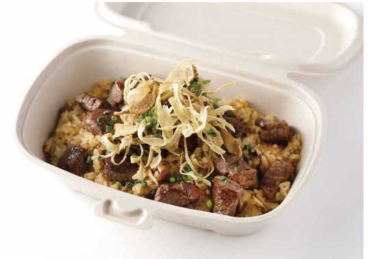
ビーフとキノコのピラフ ガーリック醤油風味

Beef and Mushroom Pilaf Flavored with Garlic & Soy Sauce