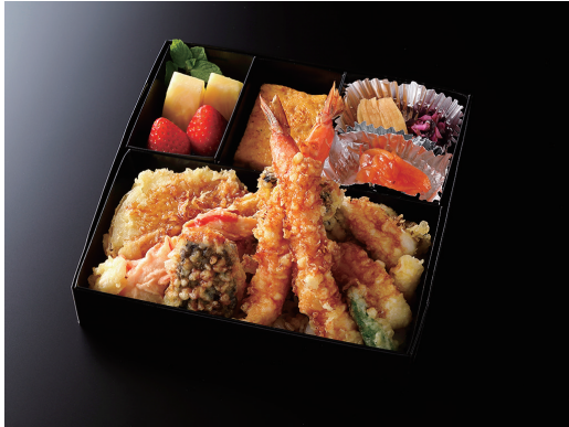
天重 (玉子焼き/香の物/酢の物/果物)

Prawn and Vegetable Tempura on Rice (Japanese rolled omlet/Japanese Pickles/Vinegar dish/fruits)