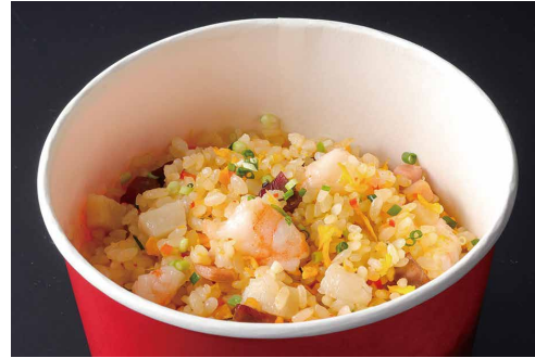
五目チャーハン Fried Rice with Shrimp, Pork and Vegetables