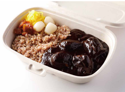
銀座シュリンプカレー

※ライスを白米又はJシリアル米よりお選びください。 Old Fashioned Shrimp Curry with Steamed Rice ※Please choose white or multi-grain rice.