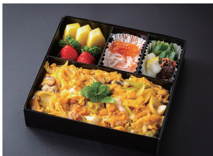
穴子かつ重 (香の物、酢の物、果物付) "ANAGO" Sea Eel on Rice (Japanese Pickles/Vinegar dish/fruits) ¥ 4,800