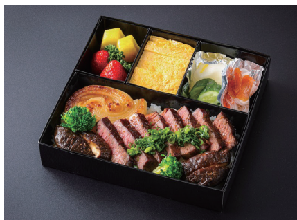
国産牛ステーキ重 (玉子焼き、香の物、酢の物、果物付) Domestic Beef Steak on Rice (Japanese rolled omlet/Japanese Pickles/Vinegar dish/fruits) ¥ 8,800