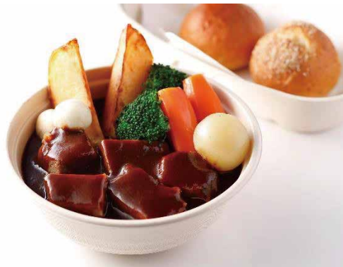
下町ビーフシチュー

※ライス（白米・Jシリアル）又はパン付き Beef Stew ※With White Rice or Brown Rice or Bread