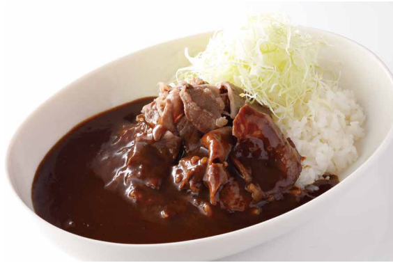
プレミアム甘口ビーフカレー Premium Mild Beef Curry