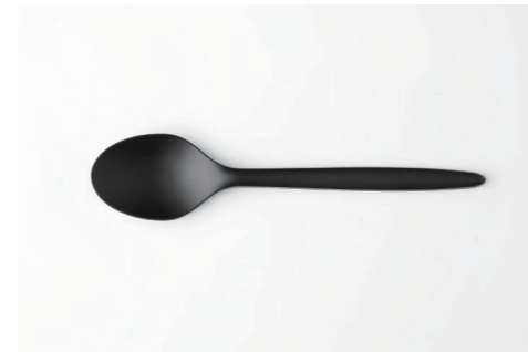
カトラリー (スプーン) Spoon ¥ 20