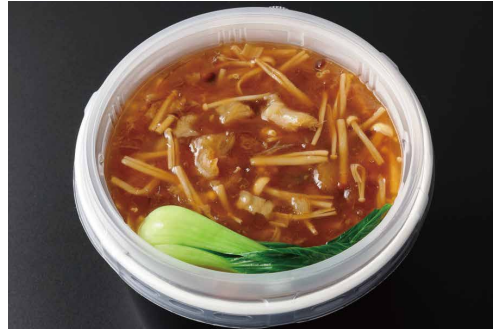
ふかひれ入りあんかけご飯 Steamed Rice topped with Shark's Fin and Starchy Sauce