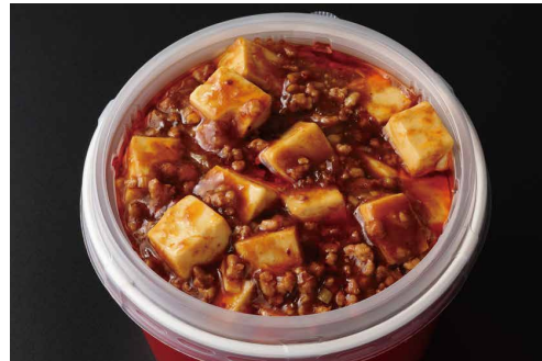
麻婆豆腐かけご飯 Steamed Rice with Spicy Braised Tofu with Minced Pork