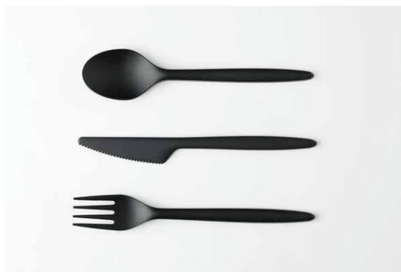
カトラリー (スプーン・ナイフ・フォーク) Each Spoon, Knife, Fork 各 ¥ 20

¥ 1,800 (追加1個 ¥ 800) Additional charges 1 Piece ¥ 800