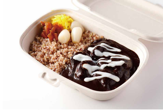
銀座ビーフカレー

※ライスを白米又はJシリアル米よりお選びください。 Old Fashioned Beef Curry with Steamed Rice ※Please choose white or multi-grain rice.