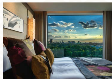
エグゼクティブハウス 禅

ホテルニューオータニ(東京)では 世界有数の権威を誇る「フォーブス・トラベルガイド2026」にて、 「エグゼクティブハウス 禅」は7年連続で最高評価の5つ星を、 「ザ・メイン」は6年連続で4つ星を受賞いたしました。