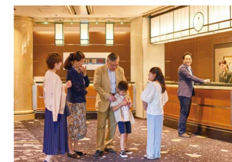
チェックアウト たくさんの思い出を胸に、 笑顔とともに歩み出す新しい一年。