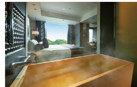
ザ・メイン 新江戸デラックス ダブル (45㎡)