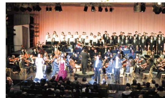
ニューオータニオーケストラ・合唱団 大晦日ガラ・コンサート&第九公演 年末といえば、第九の調べ。 ご家族そろって名曲に浸る、心に残る特別な夜。