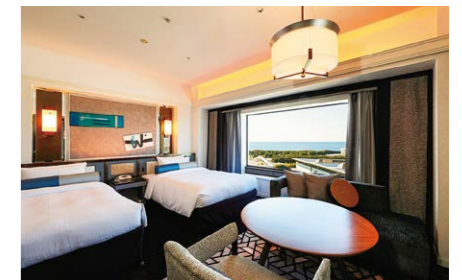
スーパーリアコーナー ツイン (51㎡)

幕張 ご予約・お問合せ Tel: 043-297-6666 (客室予約 10:00~18:00)