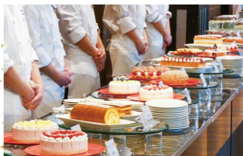
スイーツビュッフェ SWEETS COLLECTION ~PIERRE HERMÉ PARIS & SATSUKI~ 美しいデザートの数々をお好きにだけ。 甘い幸せで、贅沢なひとときを。