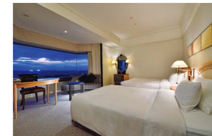
スーパーリア ツイン (40㎡)