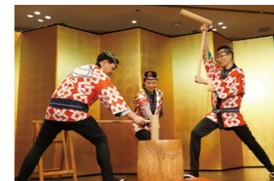
お正月の伝統が勢ぞろい。 ホテルで叶う贅沢な体験。