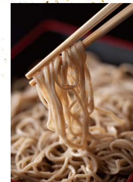
年越しそば 一年の感謝とともに、 心あたたまる一杯を。