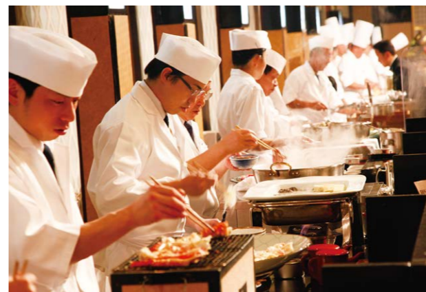
グルメビュッフェ 紀尾井町グルメプレゼンテーション 一年の締めくくりは、贅を極めた華やかなビュッフェと家族の笑顔で。