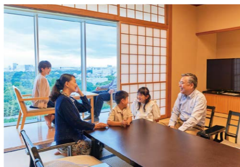
チェックイン 「おかえりなさい」家族が集う、第二の我が家。