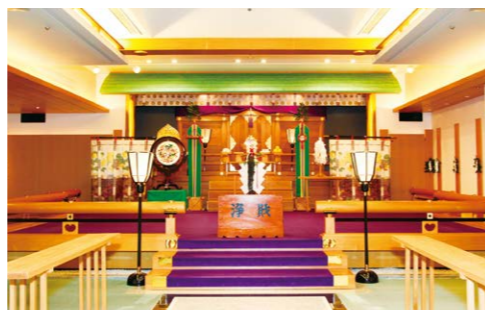
幸福殿 初詣 その一礼に、願いを込めて。 心新たに迎える、佳き一年。