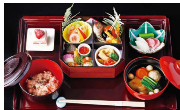
おせち 日本の心、おせちとともに。 「あけましておめでとう」家族の団樂が広がる朝。