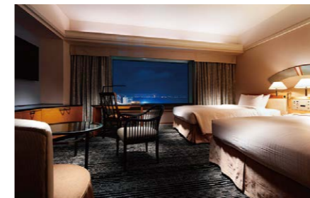
モデレート ツイン (36㎡)