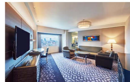
ガーデンタワー スイート (74.7㎡)

東京 ご予約・お問合せ Tel: 03-3234-5678 (客室予約 9:00~18:00)