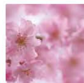
④ ヤエザクラ 時期: 4月中旬~5月上旬 Prunus Lannesiana / "Yaezakura" Cherry