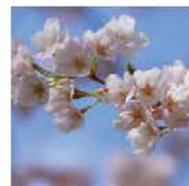
⑨ ソメイヨシノ 時期: 3月下旬~4月初旬 Prunus Yedoensis / "Yoshino" Cherry