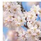
③ ヤマザクラ 時期: 3月上旬~4月中旬 Cerasus Jamosakura / Hill Cherry