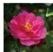
⑥ サザンカ 時期: 10月上旬~2月上旬 Camellia Sasanqua