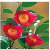
⑫ カンツバキ 時期: 11月上旬~2月上旬 Camellia hiemalis