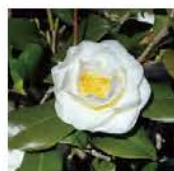
⑪ ツバキ 時期: 1月下旬~5月上旬 Camellia