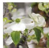
⑩ ハナミズキ 時期: 4月中旬~5月上旬 Flowering Dogwood