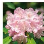
⑦ シャクナゲ 時期: 4月下旬~5月上旬 Rhododendron

営業時間/Hours 7:00am-10:00pm 席数/Seats 200席 ご予約・お問合せ Tel. 03-5226-0246