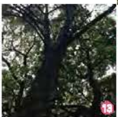
⑬ イヌマキと⑭ カヤ Ancient trees: Japanese Nutmeg & Yew Plum Pine trees 共に天明年間(1780年代)からこの地に生育していたものと考えられ、樹齢200年以上の非常に貴重なものです。2009年4月に千代田区の天然記念物に指定されています。