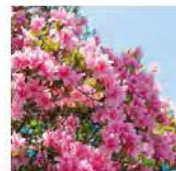
⑧ ツツジ 時期: 4月下旬~5月中旬 Azalea