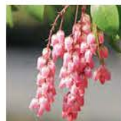
② アセビ 時期: 3月上旬~4月中旬 Japanese Andromeda

An expansive 10 acres with a history of over 400 years, Hotel New Otani Tokyo's Japanese Garden is known as one of the most outstanding gardens in Tokyo.